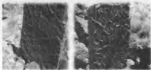
Удивительные каменные надгробные плиты

В одной из летних экспедиций, которая проходила под девизом «Ауылым алтын бесігім», на северных предгорьях Улытау, на берегу реки Караторгай, как раз на границе Карагандинской и Костанайской областей, я наткнулся (нашел) на места древнего захоронения, где до сих пор возвышаются вот эти надгробные плиты.